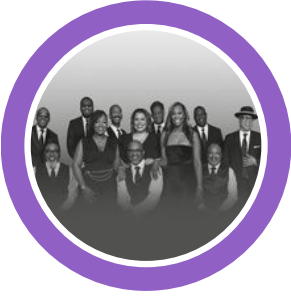
THE MEMPHIS MUSIC HALL OF FAME BAND ESTADOS UNIDOS