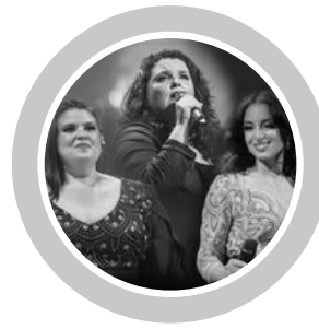
CITY DOCK BAND CANARIAS-ESPAÑA