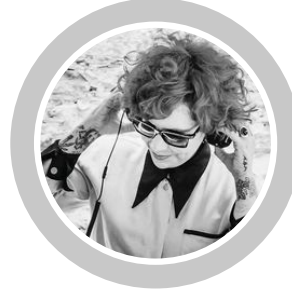
DJ VAMP CANARIAS-ESPAÑA