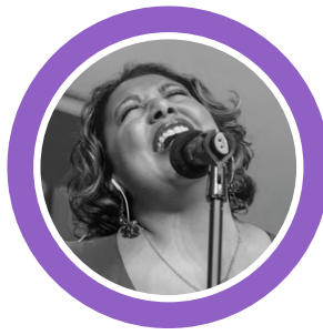
CANDY FOX ESTADOS UNIDOS